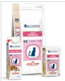
Gesteriliseerde poezen tot 7 jaar.

Wanneer u meerdere katten van verschillend geslacht heeft kan uw dierenarts Young Adult aanbevelen. Deze voeding verenigt de belangrijkste producteigenschappen van Young Female en Young Male.