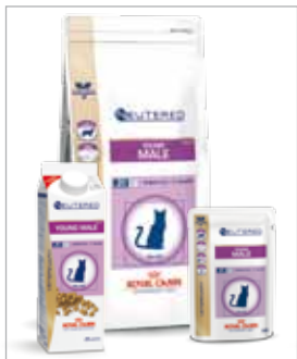
Gecastreerde katers tot 7 jaar.

Het is aan te bevelen om direct na de castratie over te schakelen op speciale voeding voor de jonge, gecastreerde kat. Hierdoor kunt u overgewicht, dat de laatste groeifase van uw kitten kan verstoren, voorkomen. Royal Canin biedt voor jonge, gecastreerde poezen en katers de Young Female en Young Male gezondheidsvoedingen. Deze voedingen voor de gecastreerde kat zijn alleen verkrijgbaar bij uw dierenarts.